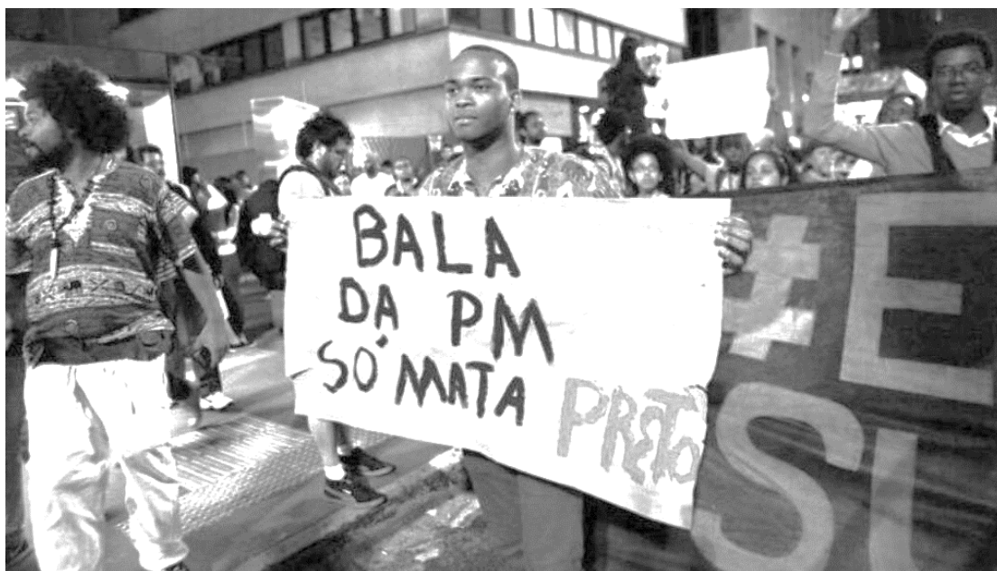
Figura 2- Figura 1- https://www.causaoperaria.org.br/acervo/blog/2017/06/14/cada-100-mortos-71-sao-negros/#.W3le8s5KjIU