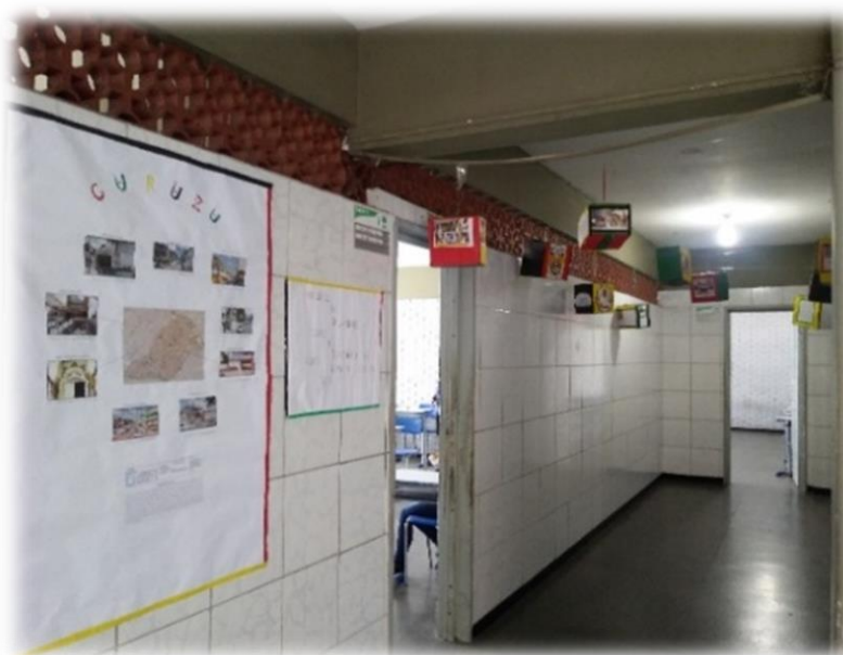
Figura 4 - Varal pronto com informações sobre o bairro