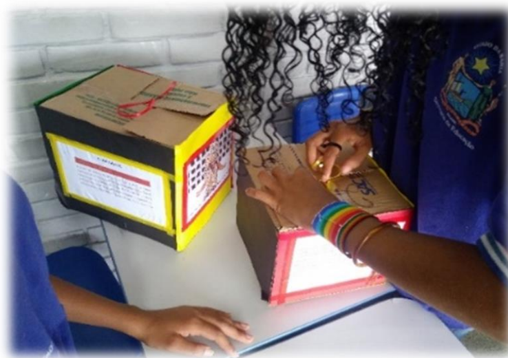
Figura 3 – Forro das caixa para formar varal