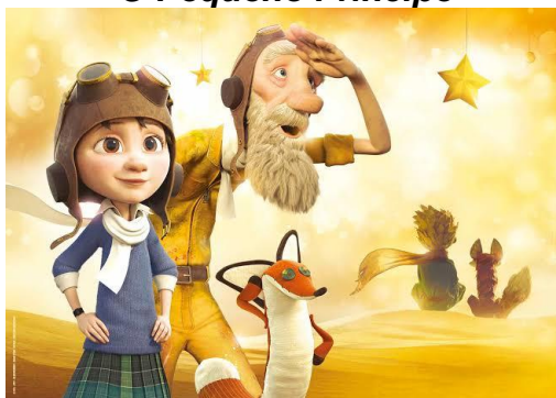
Imagem do filme disponível no Google Imagens